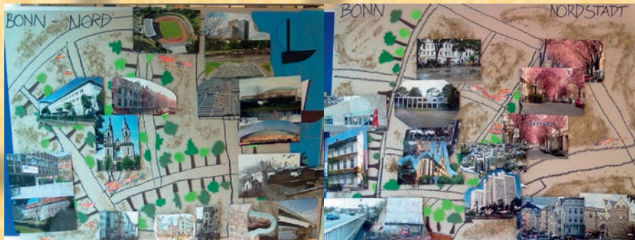
Bildbeispiele aus einem früheren Workshop

16.10 - 16.30 Feedbackgespräch, Planung des Großen Kulturrucksackfestes im Oktober 2015 und Urkunde